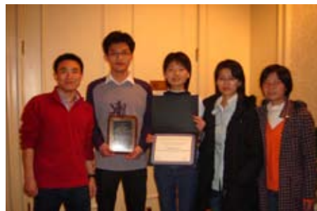
学生代表队在国际性辩论赛中屡获佳绩