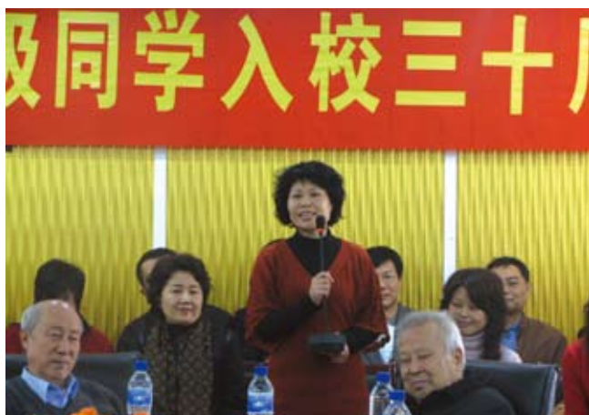
校友们在聚会上做自我介绍

奋斗奖揽入怀中。喜气洋洋的午餐后，嘉宾们为高手们颁奖，还为第一天热身赛获奖者和抽奖幸运者颁发礼品。大家互相祝贺鼓励，也相约一起坚持训练提高球技，永远朝气蓬勃。