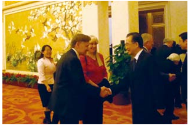
温家宝与潘维廉（左一）亲切交谈

参加会见的还有中共中央政治局委员、中央书记处书记、中央组织部部长李源潮，中共中央政治局委