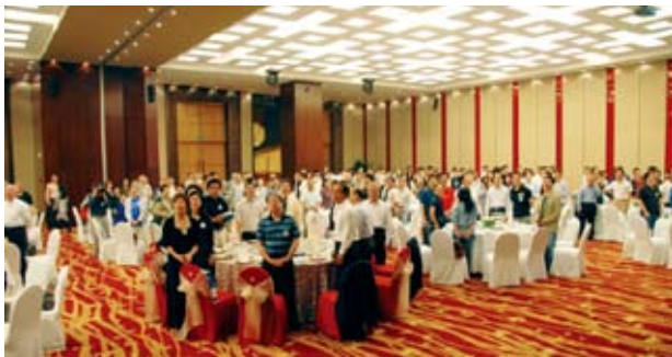
2009年5月9日，上海校友会400多名老中青校友汇聚一堂，举行2009年度校友大会，共商校友会发展大计。