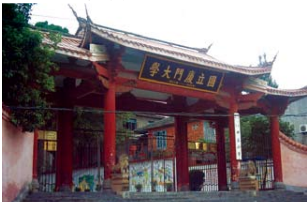
“长汀中区小学”校门——厦大长汀旧校址

一中通厦大校本部的路被堵住了，中间盖了不少新房子，只好从一中南面的马路向东走向当年厦大校门外的小巷，走到现在的“长汀中区小学”，南面有一座新建的大门楼，牌匾上写着“国立厦门大学”六个大字。我在那里拍照时，一个人走过来问我是否抗战时厦大的学生，然后开门让我们进去。越过小操