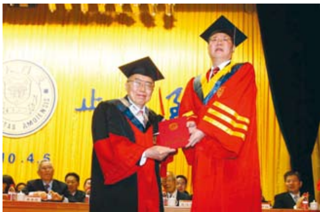
朱崇实（右）向萨支唐颁授名誉理学博士学位证书

萨支唐是国际著名的物理学和微电子学专家，1932年出生于北京，1953年毕业于美国伊利诺伊大学，1954年、1956年分别获美国斯坦福大学硕士、博士学位。1959至1964年先后任美国仙童半导体公司高级成员、物理部主任经理，1964至1968年任美国伊利诺伊大学教授。1986年当选美国国家工程院院士。1988年担任美国佛罗里达大学电机和电子工程系教授、工学院首席科学家。萨支唐是改革开放以后最早与我们国家进行科技合作与交流的美国科学家之一。2000年，他当选为中国科学院外籍院士。2003年9月、11月，清华大学、北京大学先后授予萨支唐先生名誉教授，2004年，萨支唐先生受聘为我校名誉教授。他还是台湾“中研院”院士。