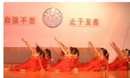
学生课外活动丰富多彩