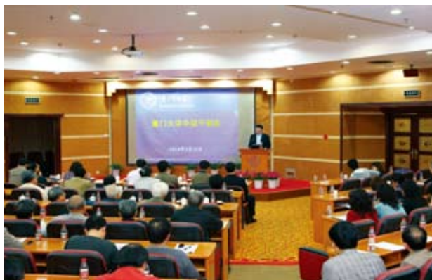
朱之文在学校中层干部会议上做重要讲话

十一、坚持关注民生，改善办学条件，提高管理服务水平。努力解决师生实际问题；加快推进翔安校区建设；扎实推进校本部基本建设任务；加强对党政干部、机关工作人员和后勤管理人员的考核工作，进一步改进工作作风，不断提高管理水平；加强国有资产和后勤管理；加强财务管理；加强信息化建设。