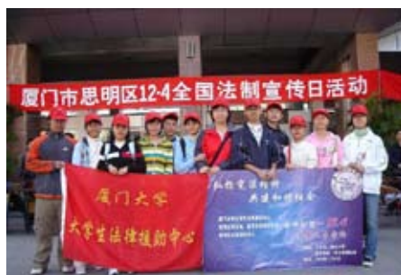
学生参加法制宣传义务咨询活动