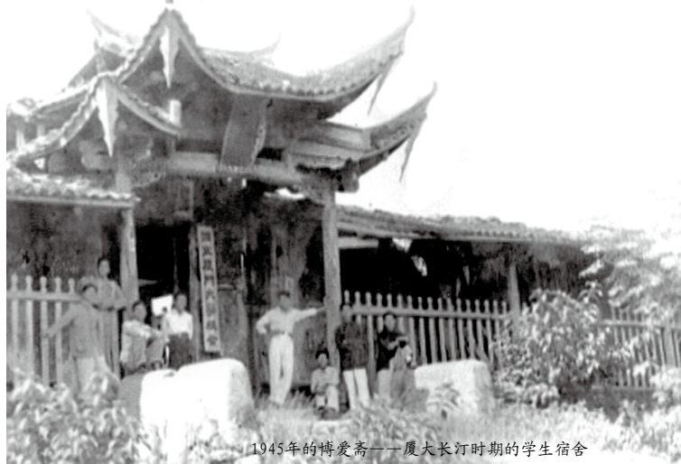
1945年的博爱斋——厦大长汀时期的学生宿舍