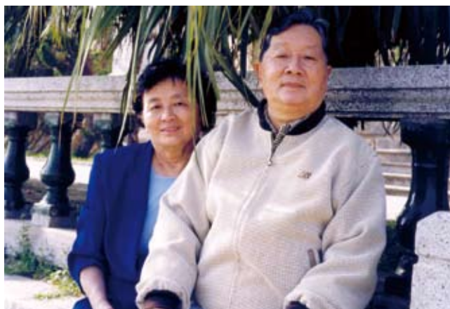
葛家澍与夫人在一起

1983年，围绕“会计的本质是什么”这一问题，葛家澍在《会计研究》上发表“关于会计定义的探讨”一文，提出“会计是一个以提供财务信息为主的经济信息系统”。文章开创性地将西方会计的“信息系统论”系统介绍到中国，并创造性地提出了会计具有“以