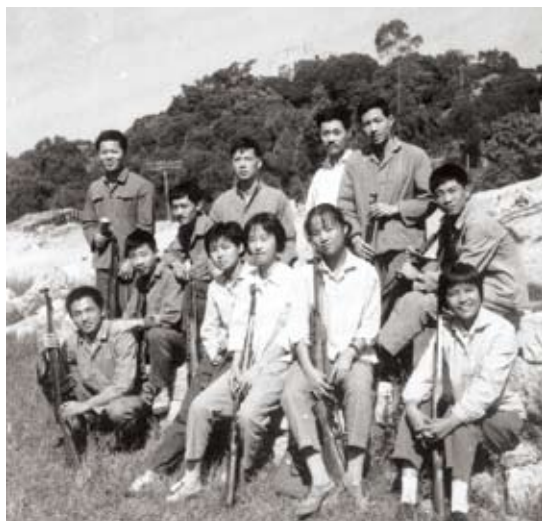
“荷枪实弹”的大学生——化学系1977级无机班

(作者系我校1977级化学系校友，本文原载于《厦门大学美洲校友会校友通讯》第五十二期)