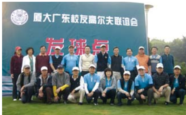
参加联谊赛的校友们合影留念