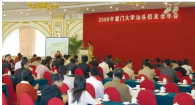
2009年，汕头校友会召开年会

“路漫漫其修远兮，吾将上下而求索”。今后汕头校友会将更好地架起沟通的桥梁、联系的纽带、交流的平台，为校友，提供更及时、更优质的服务；为母校，多做一份贡献；为社会，多尽一份责任。