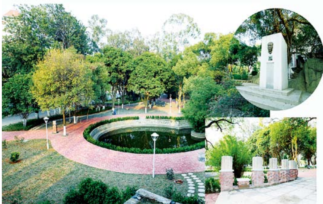
修葺后的本栋广场剪图