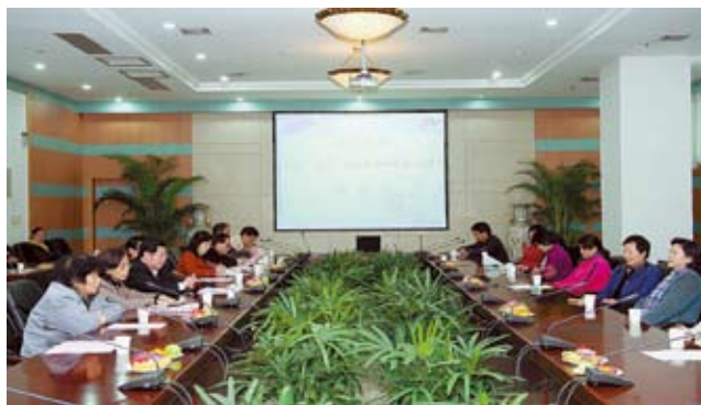
学校纪念“三八”国际劳动妇女节100周年座谈会会场

共庆百年“三八”、共话百年进步、共谋发展大计，3月8日下午，嘉庚主楼215会议室春意盎然，温情洋溢，我校妇女代表欢聚一堂，举行纪念“三八”国际劳动妇女节100周年座谈会，畅谈如何发挥女性优势，为世界