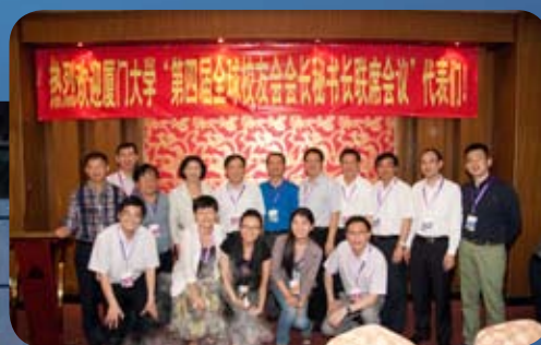
学校、校友总会领导与会议工作人员