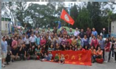
联谊校友，组织度假活动