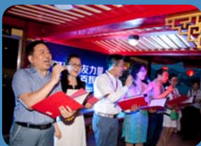
激情朗诵《我是厦大人》