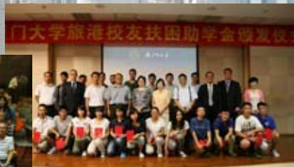
感恩母校，为福建老区考取母校的优秀 贫困新生颁发助学金