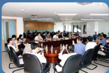
会议代表分组讨论，交流校友工作经验