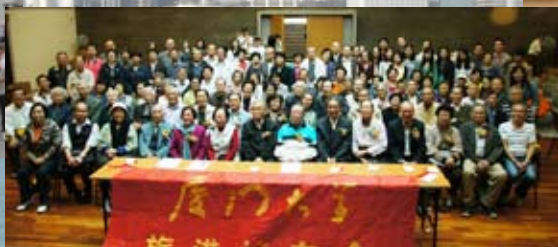
发扬中华民族的优良传统，开展敬老活动