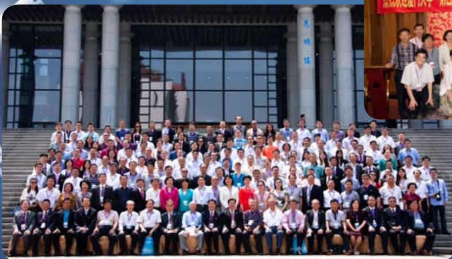
学校、校友总会领导与全体参会代表合影