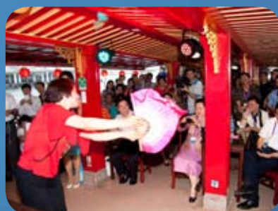
《扇舞》翩翩，其乐融融